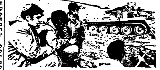
בני הכנה להגנה, כשהם עומדים ליד הטנק.

בני כל חזרו היטור על השכונות, שבהן המירדף נמשך ארבעה ימים במשך המירדף.